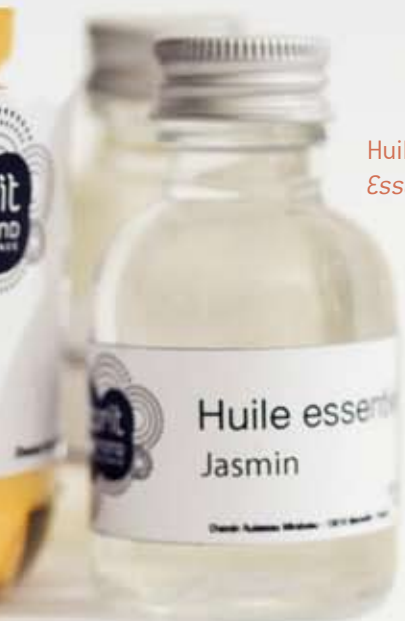
Huiles essentielles & extraits Essential oils & extracts