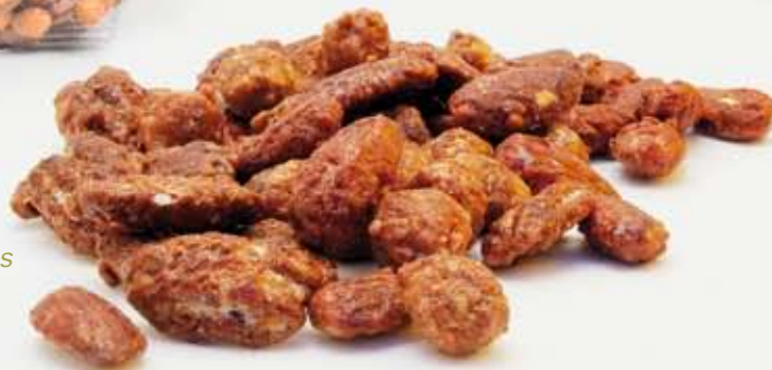
Pralines / Caramelized nuts