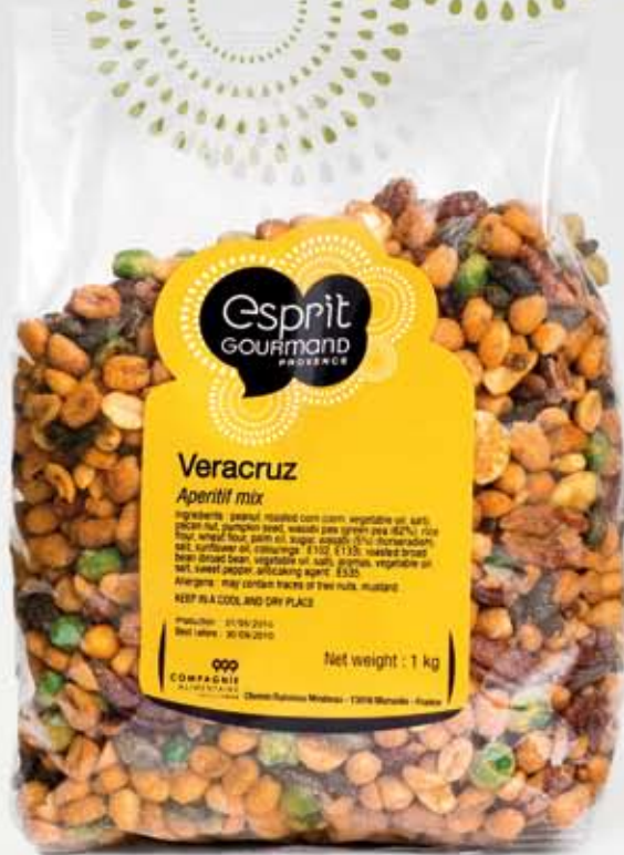
Mélanges apéritifs Aperitif mixes

A large product range, a lot of novelties.