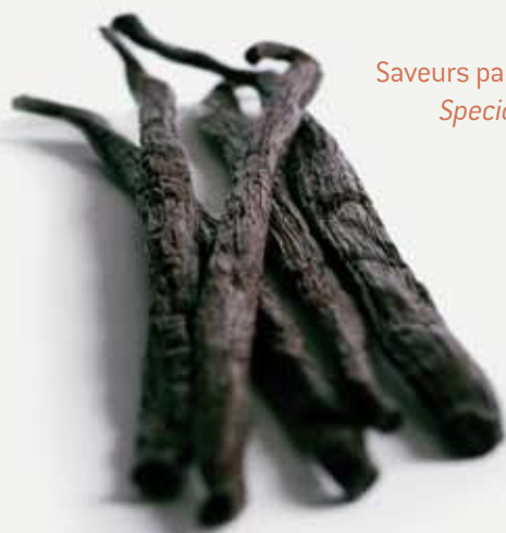
Saveurs particulières Special flavours