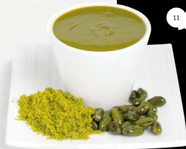
Pâtes & pralinés Pastes & pralinés