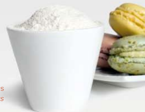
Poudres de fruits secs Nut powders