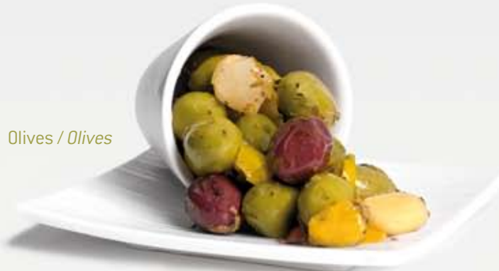
Olives / Olives